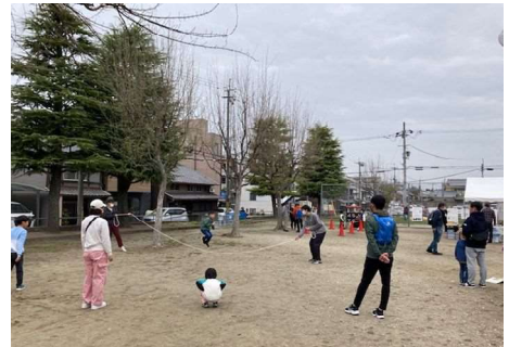
北鍵屋公園での現地イベントの様子

より広い範囲で地域の方の意見を募集するため、現地イベントを実施しました。公園の未来像と(株)セブンイレブンの提案について、意見を聞きました。