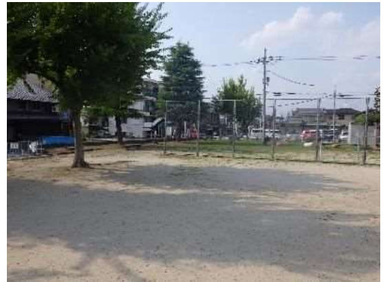
▲ 北鍵屋公園（通称、消防公園）

また、公園の管理に協力いただいている愛護協会の方々も高齢化が進んでおり、現在の状態で公園を保ち続けることが難しくなってきています。